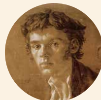
[5] Philipp Otto Runge, Selbstbildnis am Zeichentisch, 1802