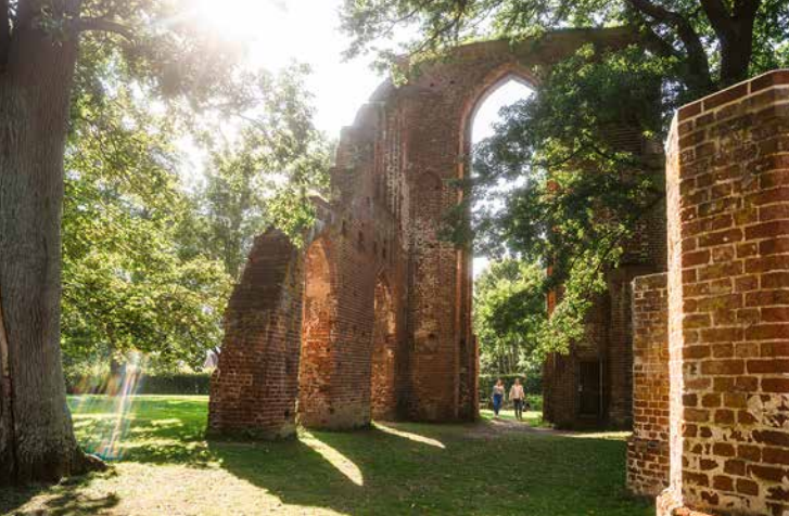
[1] Klosterruine Eldena in Greifswald