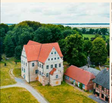
[8] Schloss Ludwigsburg

Durch das Biosphärenreservat Südost-Rügen führt die Route über Lauterbach entlang der Stresower Bucht bis nach Klein Zicker auf die Halbinsel Mönchgut und zurück an der östlichen Küste zum Ostseebad Sellin. In Lauterbach begegnet man auf dem Weg zum Badehaus Goor einer Caspar-David-Friedrich-Skulptur auf einem Findling. Die Halbinsel Mönchgut beeindruckt mit Wiesen, Hügeln, weiten Stränden und malerischen Buchten sowie vielen Originalschauplätzen, die Caspar David Friedrich in seinen Werken verewigte. Verschiedene Aussichtspunkte eröffnen herrliche Blicke über die Region, das Festland und bis nach Usedom.