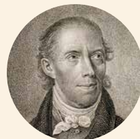
[3] Porträt von Karl Lappe, 1840