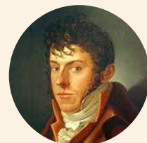
[4] Philipp Otto Runge, Friedrich August von Klinkowström, 1808