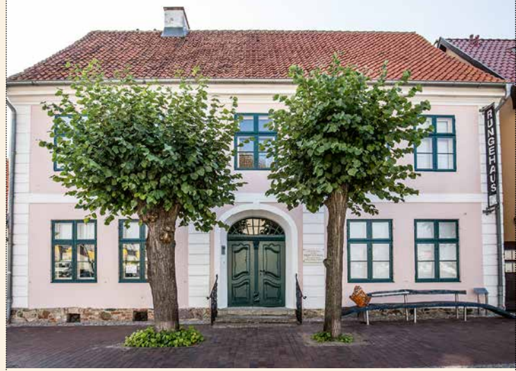
[7] Museum Rungehaus Wolgast