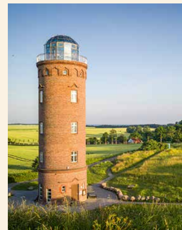
[11] Am Kap Arkona

Bevor es weiter in den Norden geht, lohnt sich ein Besuch des Kosegartenhauses in Altenkirchen, das Ludwig Gotthard Kosegarten, einem Freund und Lehrer von Caspar David Friedrich und Philipp Otto Runge, gewidmet ist. In der malerischen Uferkapelle von Vitt wartet eine Kopie von Runges Gemälde „Petrus auf dem Meer“ (1806). Nach einer kurzen Verschnaufpause am Kap Arkona mit seinen markanten Leuchttürmen und steilen Klippen, führt die Route meist entlang der Küste bis nach Wiek. Von hier verließ Caspar David Friedrich die Halbinsel Wittow immer mit einem Segelboot.