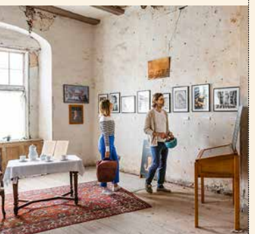
[9] Ausstellung Schloss Ludwigsburg