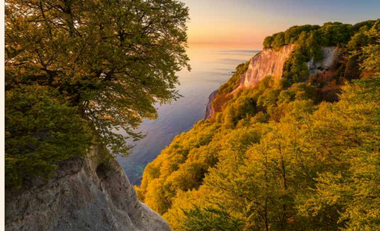
[10] Abend am Kreidefelsen im Nationalpark-Zentrum KÖNIGSSTUHL

Nach einem kleinen Bummel durch die Ostseebäder Sellin mit seiner ikonischen Seebrücke und Binz mit der prachtvollen Bäderarchitektur, gewährt das Dokumentationszentrum in Prora spannende Einblicke in die Geschichte. Bei einem kurzen Abstecher zum Baumwipfelpfad im Naturerbe Zentrum Rügen lässt sich die Schönheit der Natur aus einer ganz neuen Perspektive erleben. Auf dem Weg nach Sassnitz bieten die Feuersteinfelder südlich der Stadt einen faszinierenden Anblick, bevor sich der Tag im Hafen von Sassnitz entspannt ausklingen lässt.